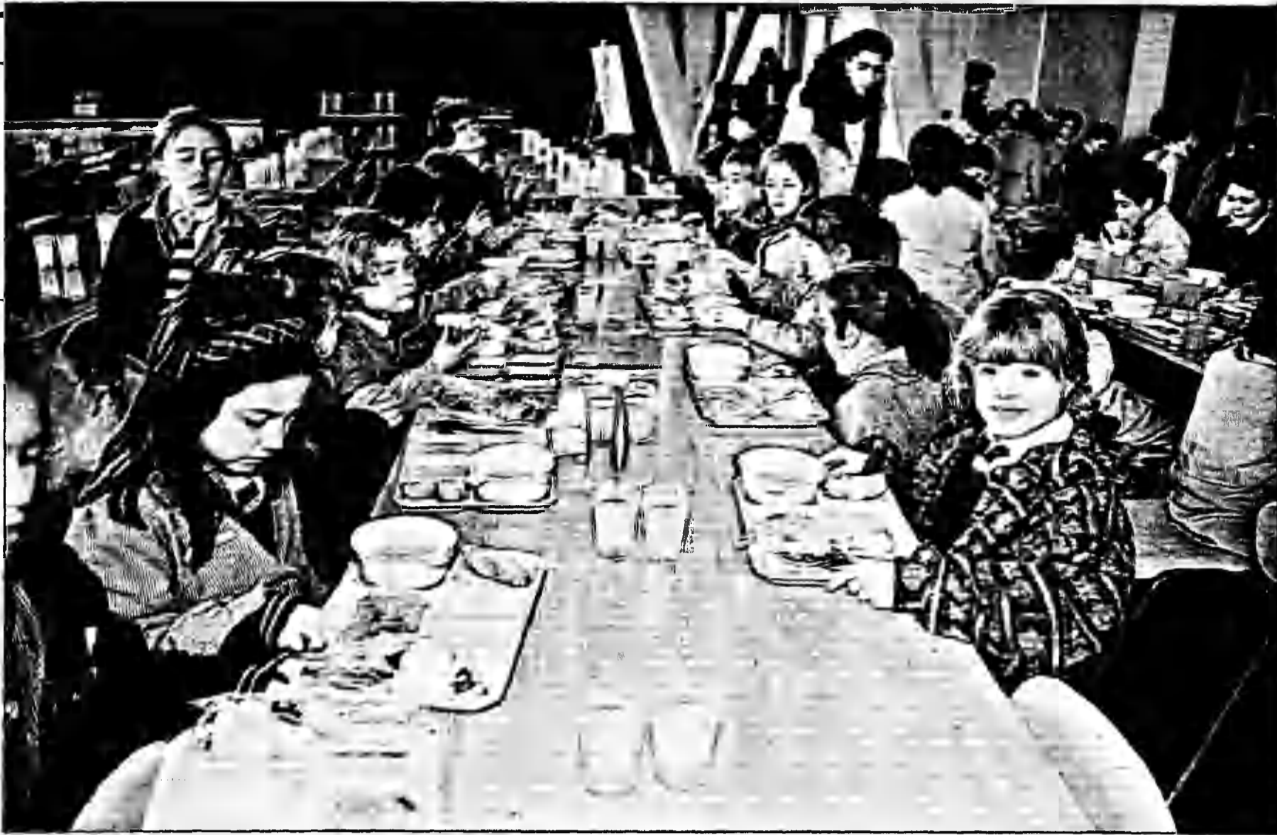
Los efectos de las presuntas irregularidades en los contratos con abastecedoras de alimentos no son menores, ya que se trata de uno de los puntos sensibles del sector educacional que llega a cerca de 900 mil niños en todo el país.

de la existencia de pagos fantasma por raciones no servidas, "ya que es posible pensar de que si a una persona se le ocurriera quitar cien raciones a alguien que maneja el orden de cien mil diarias, sería difícil que se notara el faltante. Son situaciones que pueden pasar. Si se saca mil a uno y se le pone a otro, las platas cuadran", señala otra fuente.