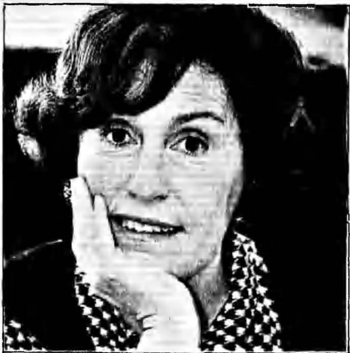
Para la nueva directora de JUNAEB, los problemas que vive actualmente el organismo se generan a partir de un crecimiento inorgánico que ha experimentado la repartición y que no ha ido acorde con las nuevas necesidades.

E STA vez les tocó a los niños, y se trata de uno de los puntos sensibles: la alimentación de los escolares en situación de pobreza.