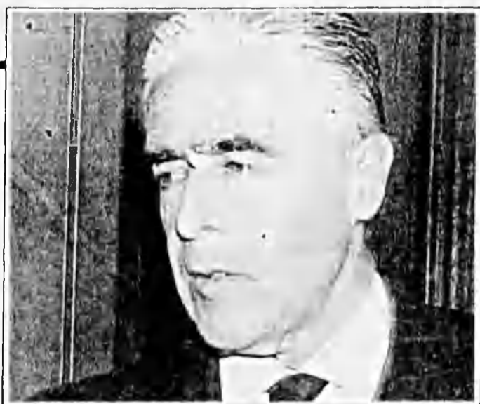
Visita del ministro Bañados a Pichidanguí provocó sorpresa entre militares.

El Supremo, ante tanta negativa, impávido, hizo mutis en busca de otro sitio.