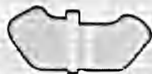
Mina Mariposa O'Butterfly

La mina que produce onda de choque, contiene suficiente explosivo para causar heridas mortales. Algunas están diseñadas de tal manera que es prácticamente imposible desactivarlas.