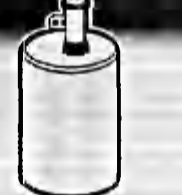
Mina Saltadora OZM-4