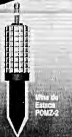
Mina de Onda de Choque

En las minas de onda de choque, al ser activadas, la explosión produce una onda de choque que mata o mutila a quienes se encuentren en su radio de acción. La mina mariposa o "butterfly", que se activa desde un avión o helicóptero y cuya insólita forma atrae a los rifles que crean que se trata de un juguete.