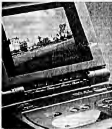
Reproductor personal de video para ver con libertad las opciones de entretenimiento ofrecidas por American Airlines.

Dentro del servicio general de almuerzos y comidas en la Clase Ejecutiva así como en Primera, se ofrecen tres