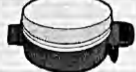
Mina de Onda de Choque

dejó limitado, todavía conserva algo de ese hombre joven, lleno de vida y trabajador. Prueba de ello es que hoy, aun cuando sólo tiene dos muñones, construye una casa en San Pedro.