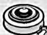
Mina AP P4